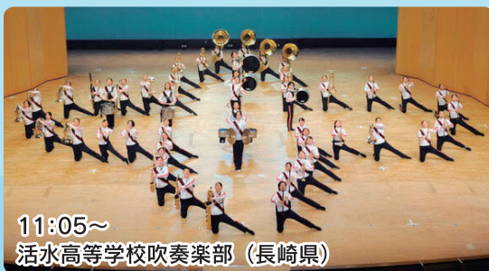
11:05~ 活水高等学校吹奏楽部 (長崎県)